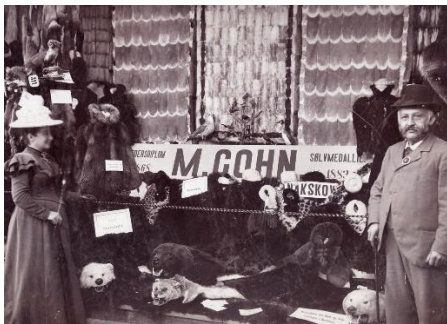
Udsnit af bogomslaget til Jødernes Danmarkshistorie - i provinsen.

I hver by føjes et lokalt kapitel til den generelle historie, der både underbygger, men også nuancerer og perspektiverer den overordnede historie.